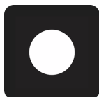
Chladně bílé světlo, 6000 K

Dálková a potkávací světla LEDDriving pro nákladní vozidla