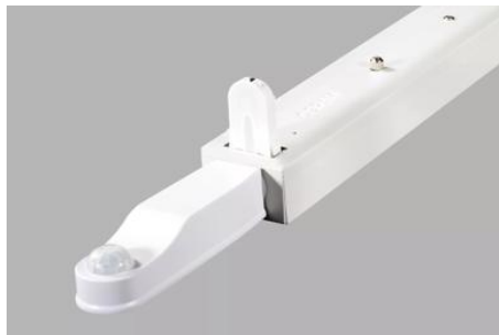
AirZing 5040 Product