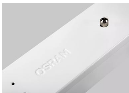
AirZing 5040 Product