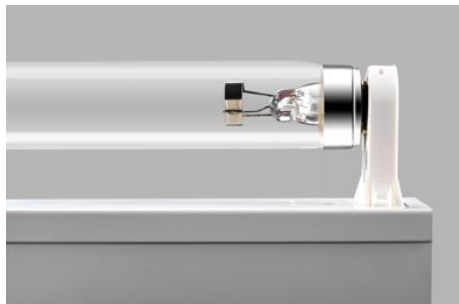
AirZing 5040 Product

PURITEC germicidal lamps emit high-intensity UV radiation that can cause sunburn and conjunctivitis. The skin and eyes must therefore not be exposed to direct or reflected unfiltered radiation.