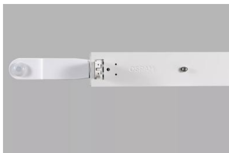
AirZing 5040 Product