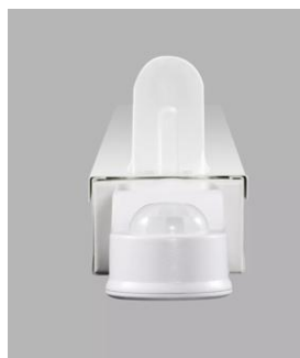
AirZing 5040 Product